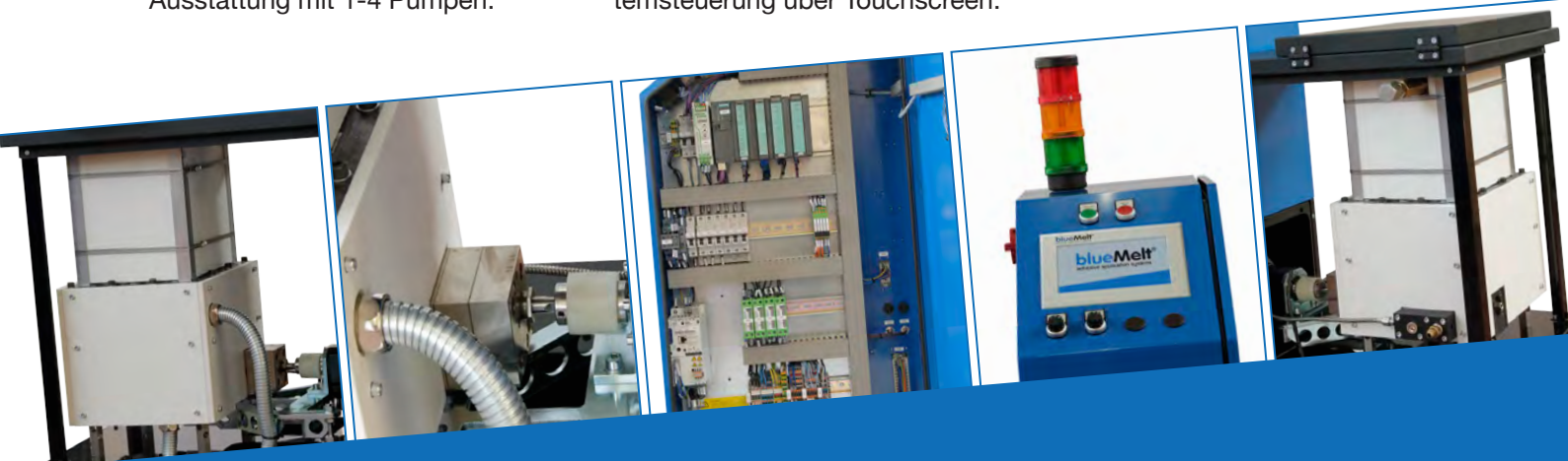
Abb. blueTank Serie

Schmale Bauform, betriebssicher für lange Standzeiten bei täglichem Einsatz. Wartungsarm.